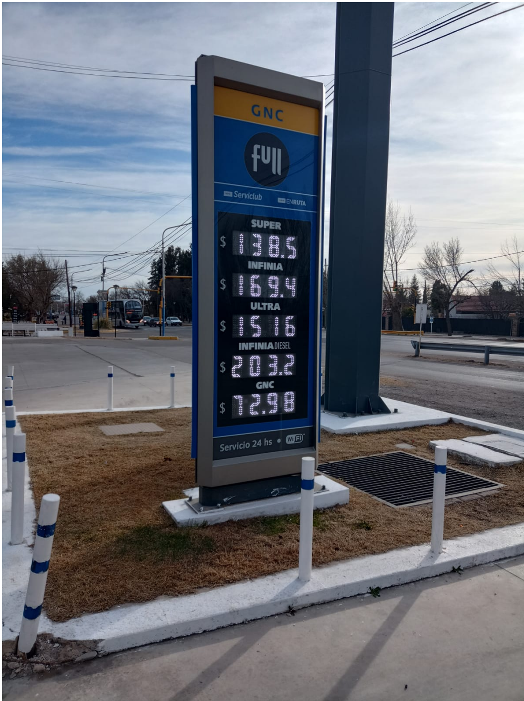
Cartelera YPF Tunuyán