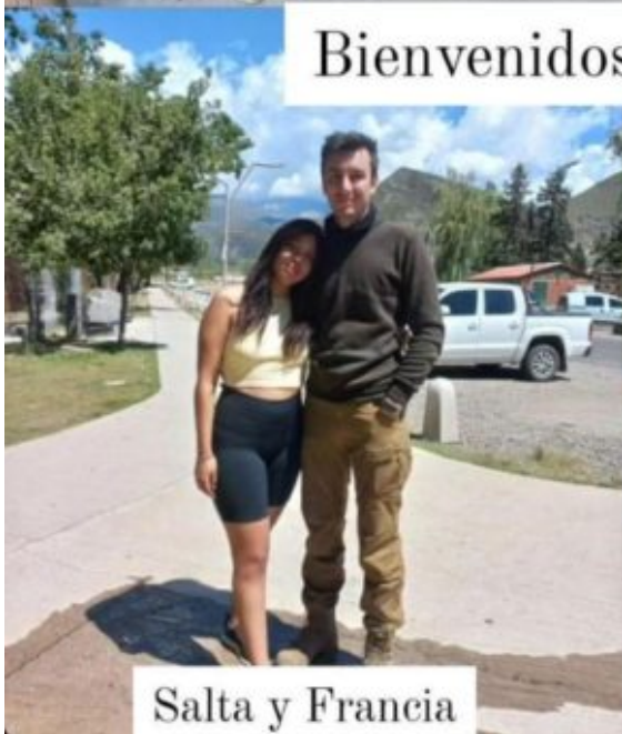
Salta y Francia