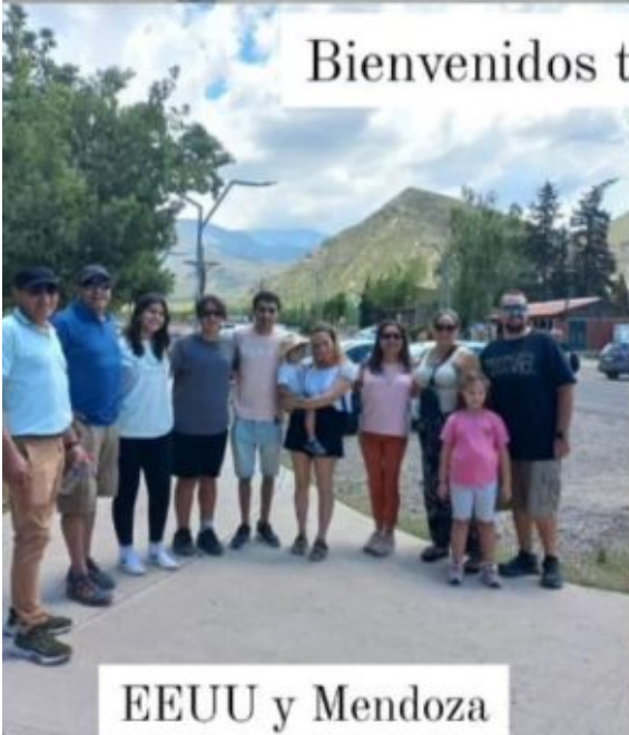
EEUU y Mendoza