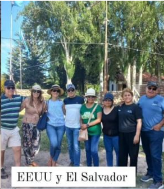
EEUU y El Salvador