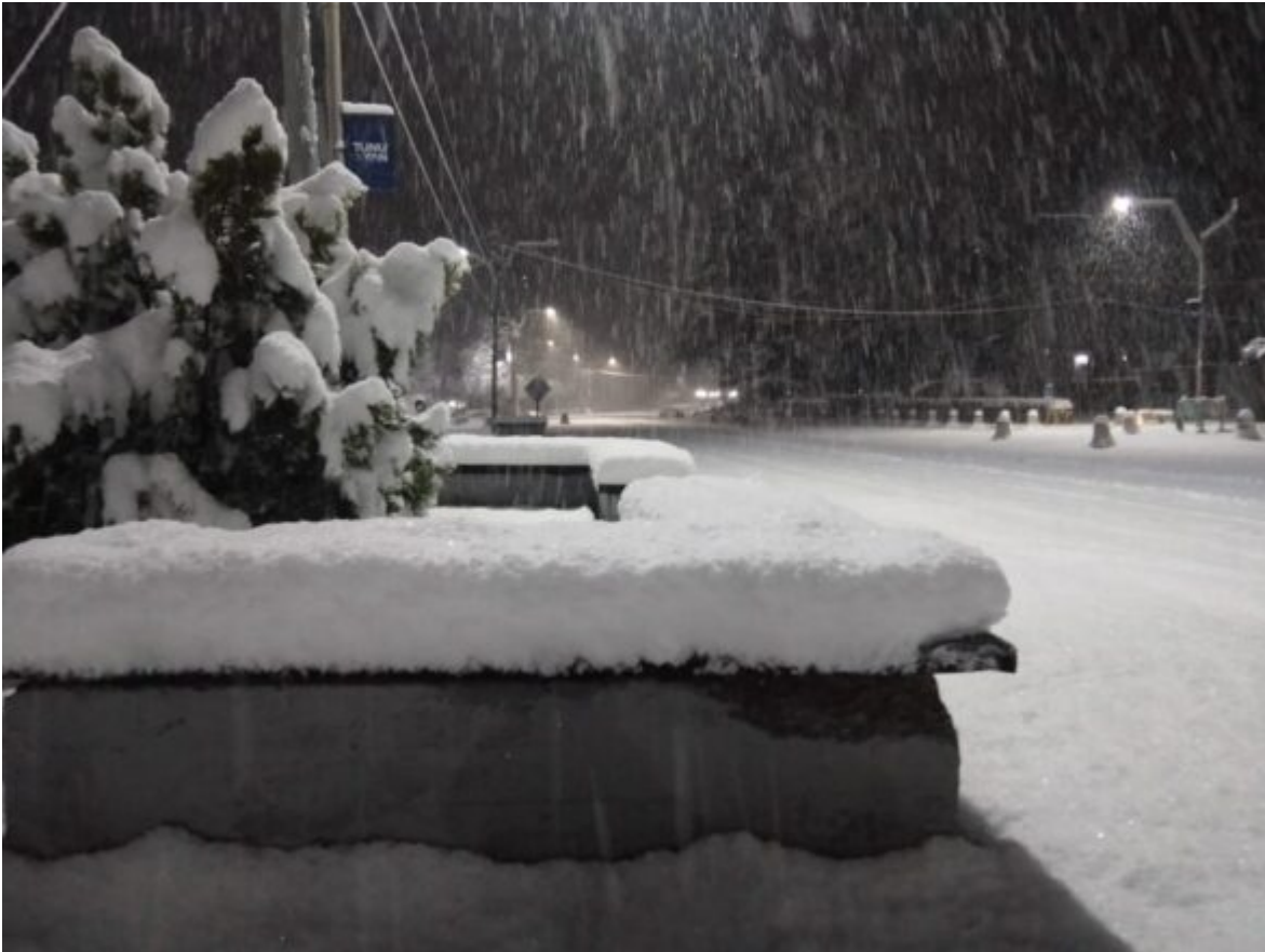
Fotos tomadas de ayer, en el Manzano Histórico

Es por eso, que se le pide a los conductores que transiten con mucha precaución para evitar accidentes.