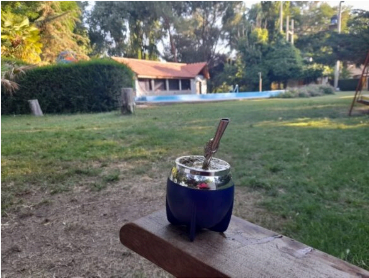
Jardín con sillas, mesas y piscina