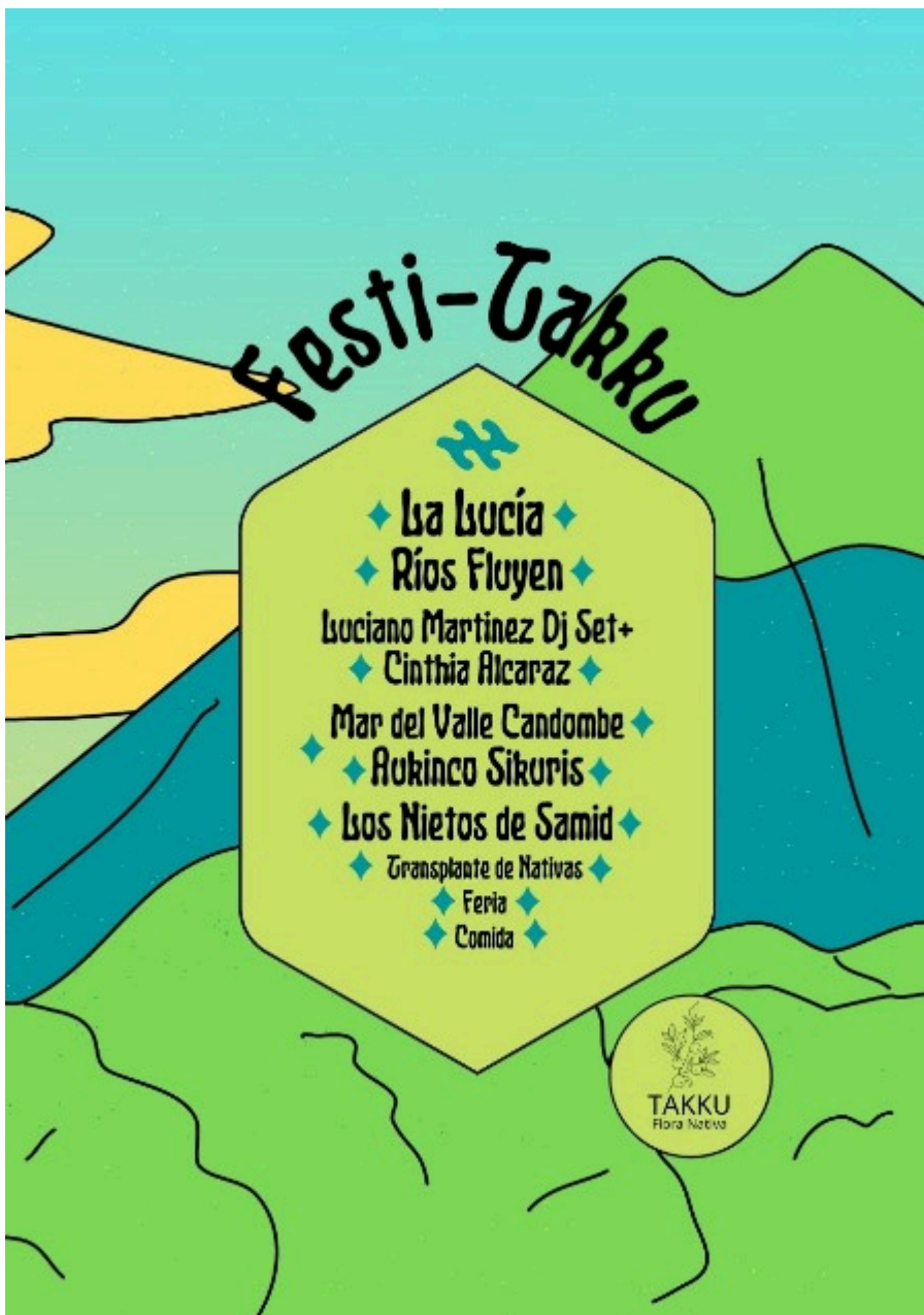
Grilla de artistas que participarán