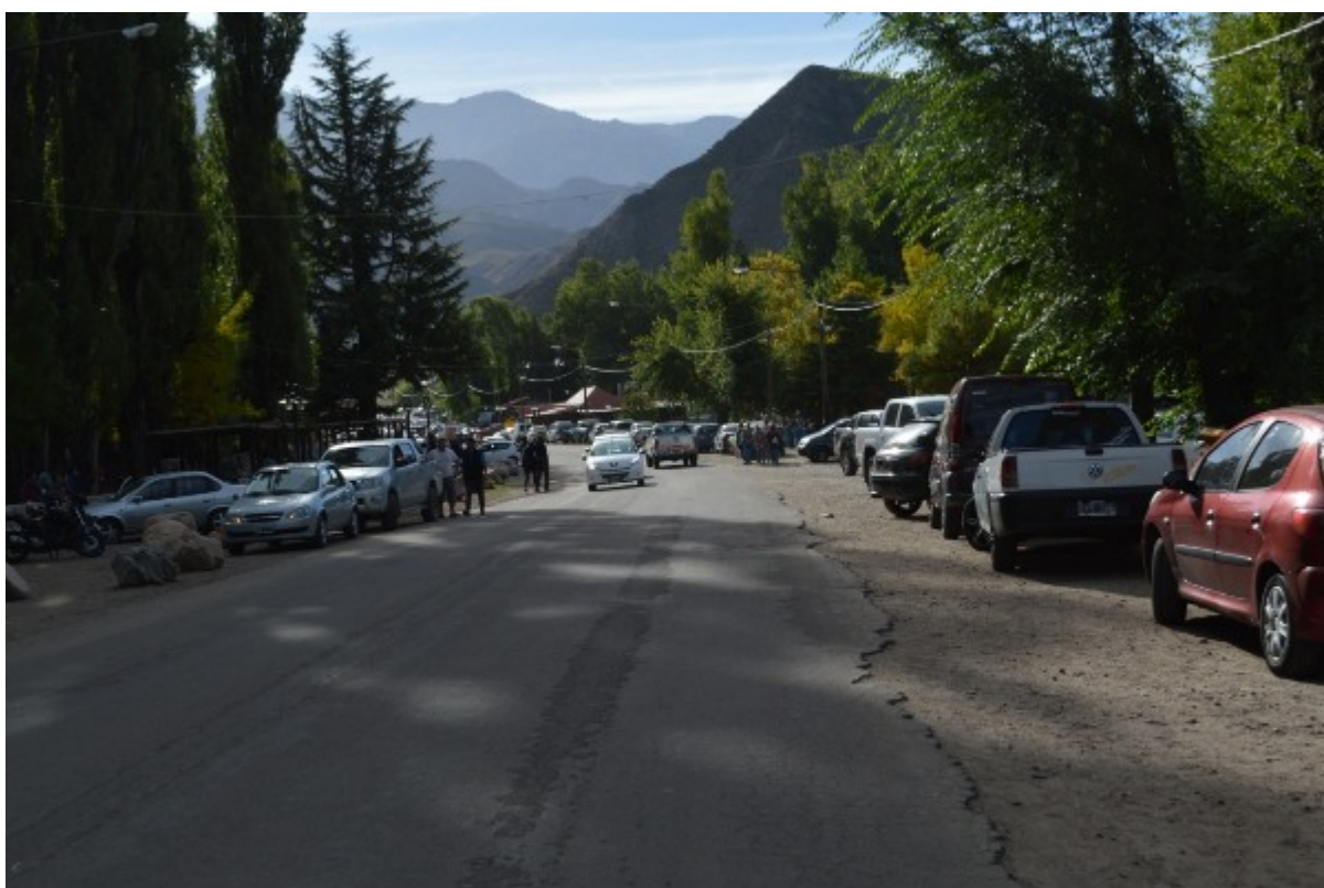
Entrada al Manzano Histórico, Tunuyán