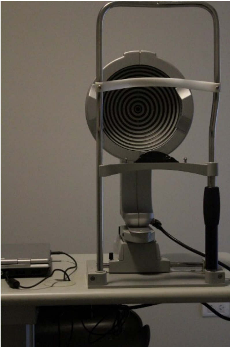
Clínica de la Visión: equipamiento

Esto es un gran salto de calidad para el Valle de Uco; no es que me quede sin objetivos, sigue habiendo objetivos en el aspecto de seguir equipando; para mí esto tiene que ser un centro de referencia en el Valle de Uco; yo tal vez “mi competencia” siempre la centré en que el paciente no se vaya a Mendoza; entonces traté de brindarle lo mejor que puedo, lo mejor que sé, para que la gente se quede acá.