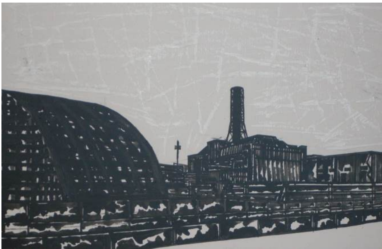
Obra de arte de Kuryj

Reflexionó que decir que los ucranianos son neonazis no tiene sentido, dado que en cuyo lugar hay muchos judíos que sufrieron en el Holocausto, y muchos de los familiares de los que están hoy día, como el actual presidente de Ucrania. Además aclaró, que “es un gobierno democrático, el cual ha llegado por las urnas, lo cual no puede decir Putin”.