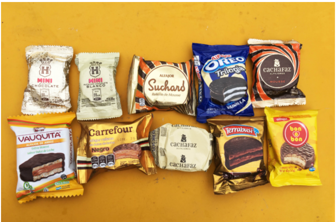
FOTO: MARCAS DE ALFAJORES DE ARGENTINA

Seguidamente afirmó: “Hoy los alfajores van desde los $300 el más barato hasta los $1200, dentro de los más buscados, ya sean simples o triples rellenos de dulce de leche y cubiertos de chocolate blanco o negro”.