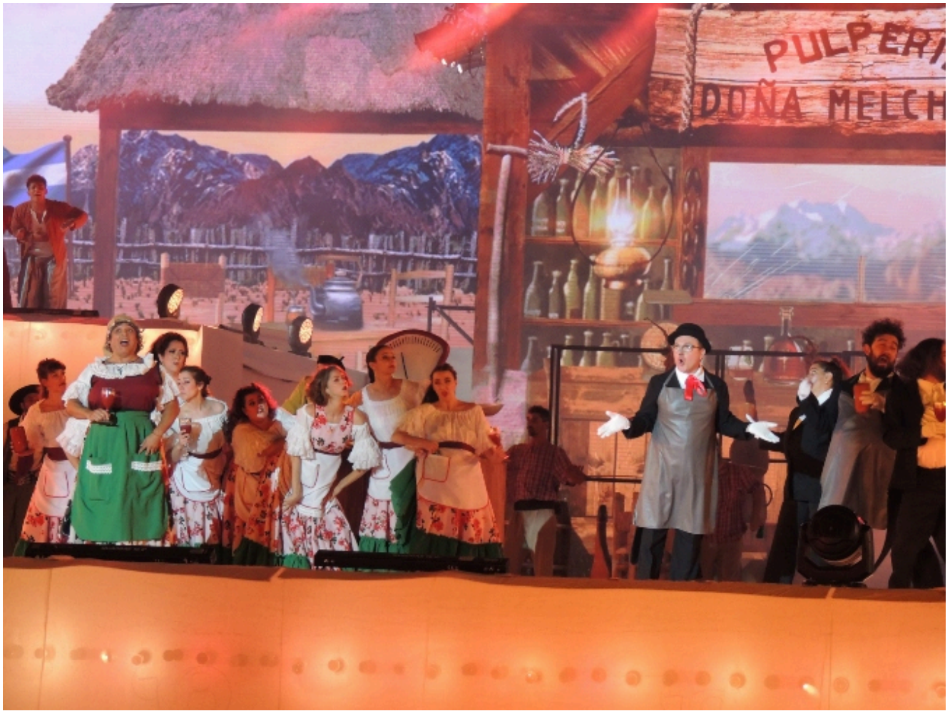
Milagro del Vino Nuevo