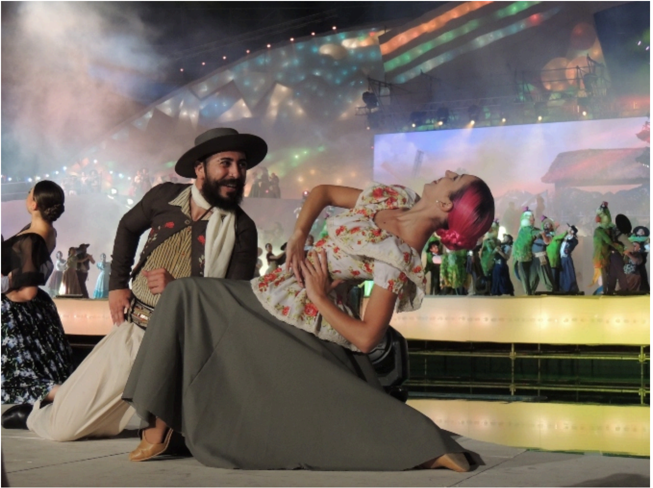
Milagro del Vino Nuevo

Luego llegó el momento más esperado de la noche. Por primera vez en la historia, Abel Pintos se presentó en el escenario de la Vendimia. Las luces del Frank Romero Day se apagaron alrededor de las 00 y se escucharon los primeros acordes de Aquí te espero. A continuación, sonriente y enérgico, Abel Pintos salió al escenario anticipando lo que sería un show memorable.